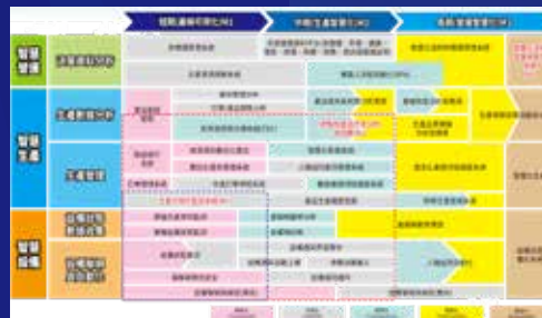
臺灣PCB智慧製造藍圖

發行單位：臺灣電路板協會 指導單位：臺灣電路板協會 自動化委員會 研究單位：臺灣經濟研究院、 財團法人資訊工業策進會 版 本：2019年